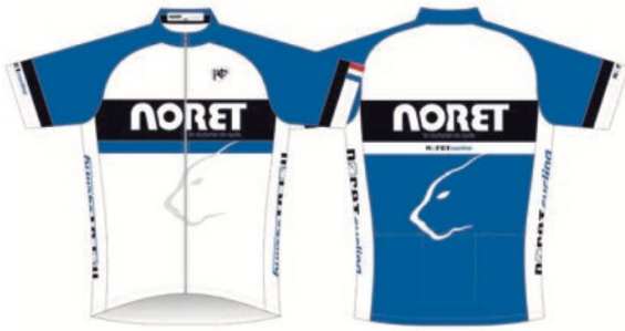
Maillot manches courtes Maillot manches longues