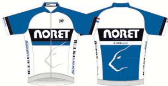
Maillot PRO+ manches courtes Maillot PRO+ manches longues