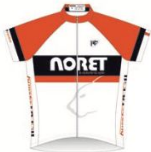
Maillot Femme manches courtes Maillot Femme manches longues

Du XXS au 4XL Coupe Homme Du 6 ans au 14 ans Coupe Enfant